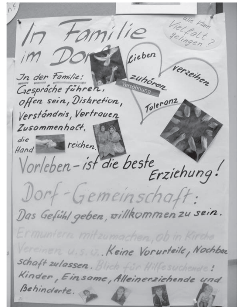
Plakat 4: Frauenvielfalt in Familie und Dorf

Gibt es eine offizielle Begrüßung zugezogener Frauen durch den Zweigverein? Werden neue Frauen und Familien auch eingeladen?