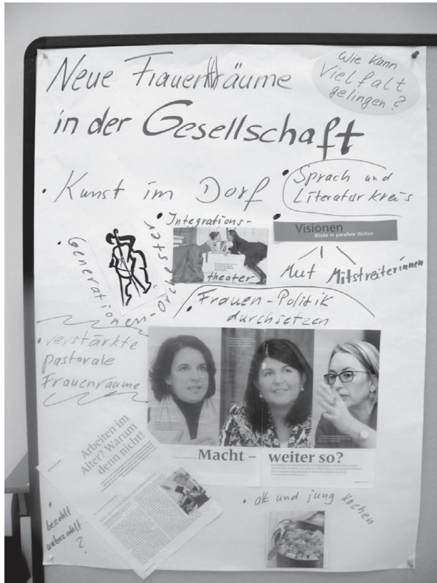
Plakat 5: Neue Frauen-(t)räume