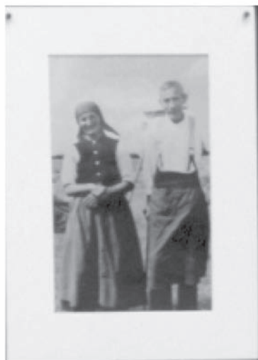
Paar auf dem Land Anfang 20. Jhd.

Die Meditation kann am Anfang oder am Schluss eines Abends zu dem Thema „FrauenVielfalt“ gelesen werden.