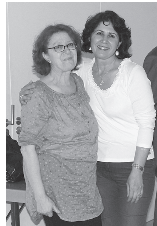
Freundinnen (Gäste auf dem Dorfseminar)

Wo wird Neues ausgebremst, zum Beispiel mit der Aussage „Das war schon immer so“?